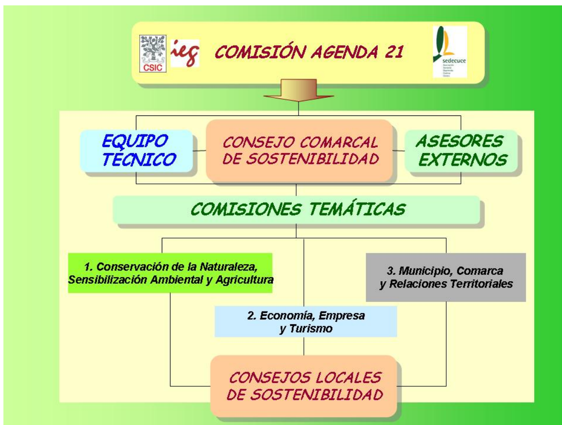
Figura 2: Estructura institucional de la Agenda 21

Para que el proceso de elaboración de la Agenda 21 Comarcal sea operativo, el Equipo Técnico propuso, en diciembre de 2007, que los órganos e instituciones participantes se organicen atendiendo a la siguiente estructura: